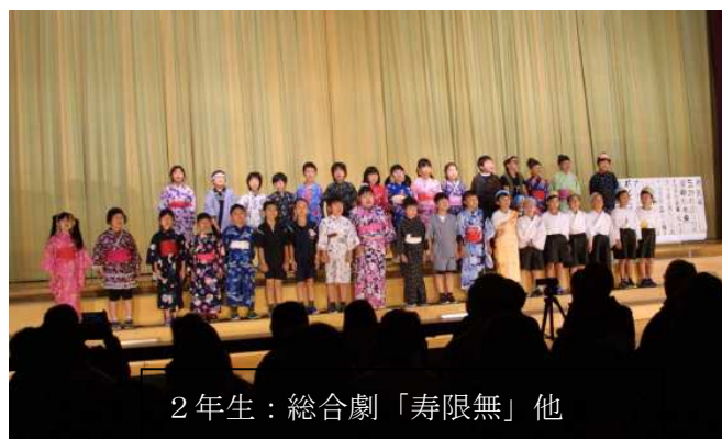
2年生：総合劇「寿限無」他