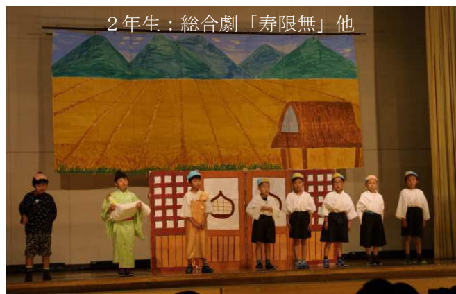
2年生：総合劇「寿限無」他

そんな子どもたちの姿を見ようと、お父さん、お母さんはもちろんのこと、おじいちゃんやおばあちゃん、そして地域の方々も大勢見に来られていました。