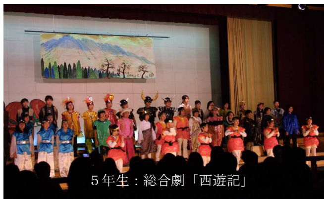
5年生：総合劇「西遊記」

1年生は初々しく、6年生は堂々と迫力があり、それぞれの学年で特徴のある「最高の学芸会」でした。