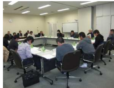
～まちづくり協議会の様子～

みなみ野公園（帯広市南の森東2丁目）水遊びで冷えた体を温めることができる彩暖室は、遊ぶ子どもを中から見守ることもできるので親にとっても嬉しい設備でした