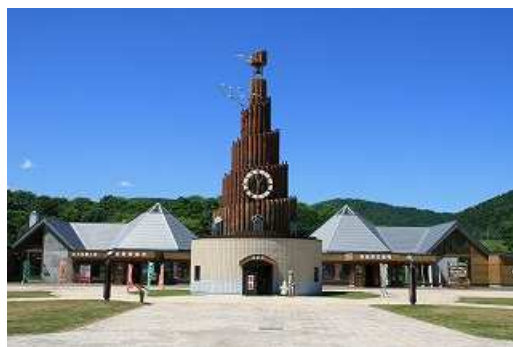
【からくりハト時計塔「果夢林」】

また、敷地内に咲き誇る花菖蒲は年々咲きが悪くなっており、「果夢林の館」の暖房機についても耐用年数経過により、劣化が進んでいる状況でありますことから、「果夢林」の防水シートの張替えを行うとともに、兼ねてから要望の多い楽曲の短縮のほか、ドッグランができる設備の新設、「果夢林の館」の暖房機の交換や花菖蒲の株分け、土入れを継続して実施するなど、北見を代表する魅力ある観光施設として持続した観光客などの集客を図るため、早急に整備を進めるべきと考えます。