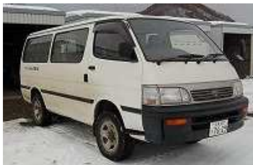
【平成7年購入の送迎車両】

平成15年に開設した市立留辺蘂ふれあいセンターにおいて、利用者の送迎に使用している車両が平成7年に購入したものであり、経年劣化及び車両全体の損耗などにより安全性が損なわれる恐れがあることから、利用者の安全・安心な送迎サービスの提供を図るため、早急に更新を進めるべきと考えます。