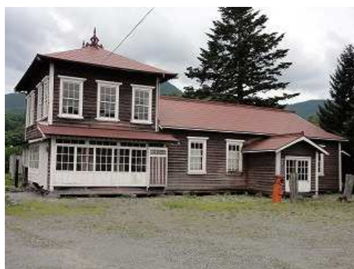
【留辺蘂町開拓資料館】

今後もこの建物を駅通として保存し、地域の歴史と文化の継承を図るため、建物の修復・保存に向け早急に整備を進めるべきと考えます。