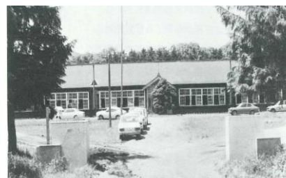
端野小学校（明治31年～昭和51年）