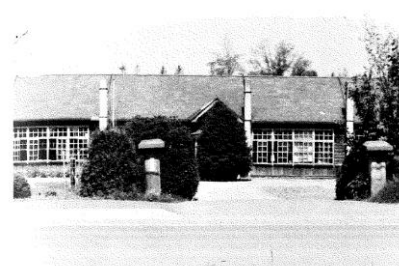
川向小学校（大正6年～昭和51年）