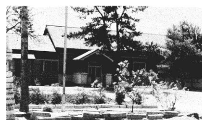
協和小学校（昭和10年～昭和51年）