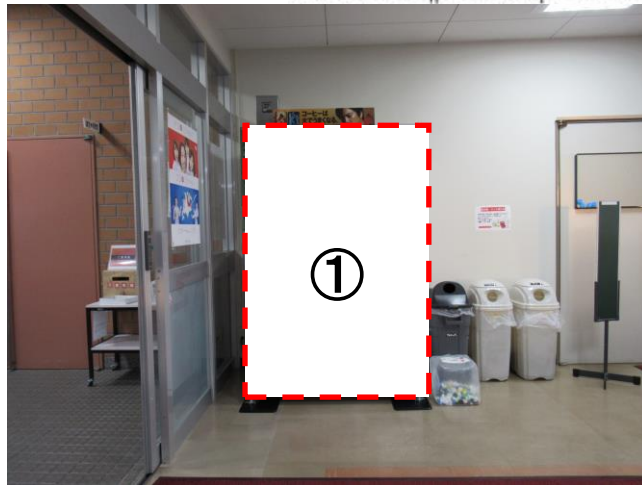
図面9 北見地域職業訓練センター 1F (北見市東三輪1丁目1番地4)