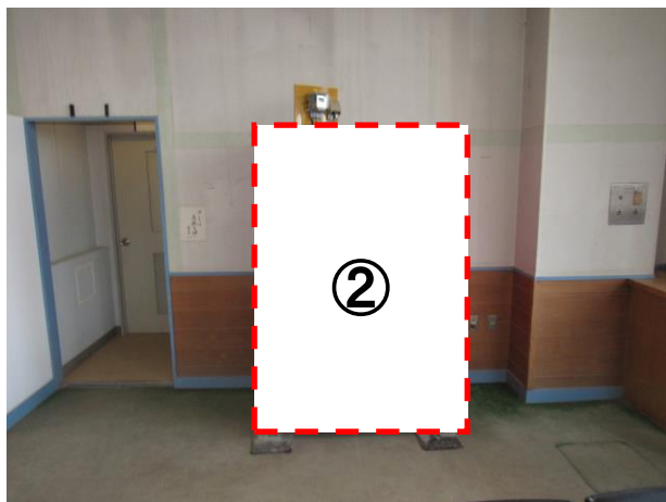
図面10 北見地域職業訓練センター 附属実習棟 (北見市東三輪1丁目1番地10)