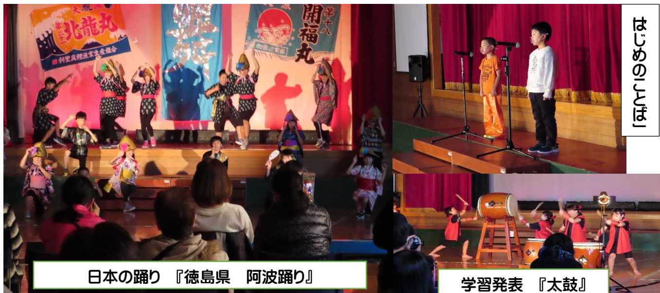
日本の踊り 『徳島県 阿波踊り』

上仁頃小学校としての活動は、あと1年と4か月です。上仁頃小の子どもたちに更なる力を身に付けさせるため、教職員一同、児童一人ひとりに寄り添い、学力の向上、体力の向上、豊かな心の育成に励み、皆様からの期待と信頼に応えるべく、教育活動を推進して参ります。今後とも、どうぞよろしくお願い申し上げます。