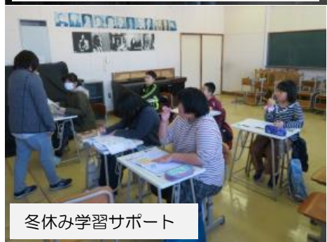
冬休み学習サポート