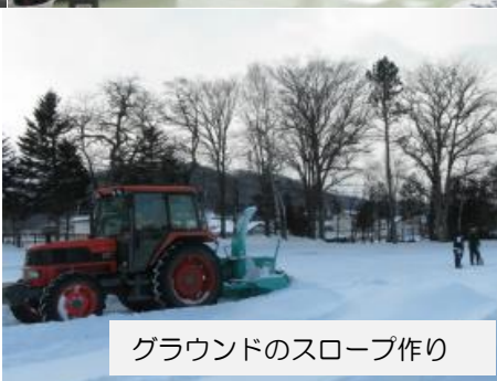
グラウンドのスロープ作り