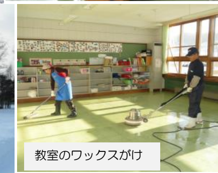
教室のワックスがけ

「平成」最後の年末年始、そして冬休みでした。児童と保護者の皆様、地域の皆様に大きな事故やけがなどの報告がなく過ごせたことが何よりで、大変うれしく思います。1月18日から後期後半の学校生活もスタートしました。皆様、よろしくお願い申し上げます。