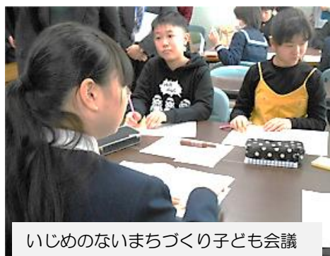
いじめのないまちづくり子ども会議