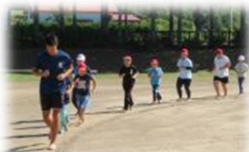
はだしになって走りました。