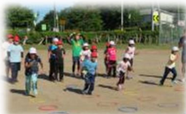
腕も脚も速く動かして走ります。

児童が、「走りたい」「体を動かしたい」という気持ちになるようなお話や、楽しみながら自然と体を動かしている指導でした。児童は「つらい」とか「苦しい」というような思いを抱くどころか、逆に「もっと動きたい」「走りたい」という意欲を引き出されていました。