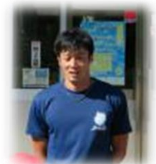
オホーツク KIDS 代表

児童はマラソン記録会に向け、朝の体力づくりや体育の授業でグラウンドを走っています。その最中の9月11日、全校体育の時間に「走り方教室」と題してオホーツク KIDS 代表の先生から体を動かすことの楽しさや走り方を教えていただきました。