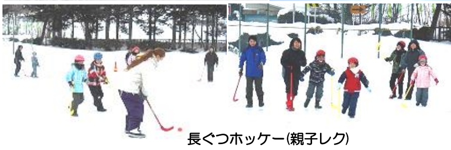
長ぐつホッケー(親子レク)