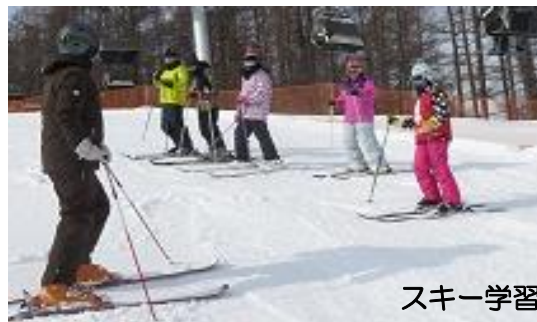
スキー学習の様子