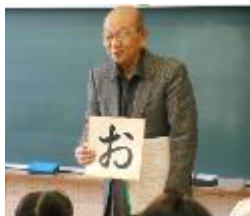
仁頃書道会会長のお話です。