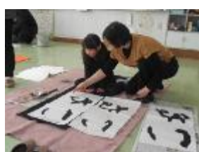
丁寧に教えていただきました。