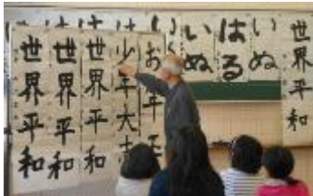
閉会式の講評（講師の先生より）

1月5日（金）に、新春恒例の「上仁頃小親子書き初め教室」を行いました。今回で8回目となります。仁頃書道会の会長をはじめ4名の書道会の皆様と、3年生以上の書写でお世話になっている先生が講師を務めてくださいました。1年生は「いぬ」、2年生は「はる」、3年生は「お年玉」、5年生は「少年大志」、6年生は「世界平和」、保護者の皆様はお子さんの学年の字を書きました。講師の先生方に事前に書いていただいたお手本をよく見ながら、親子の書き初めを通して、新たな年のスタートを切りました。