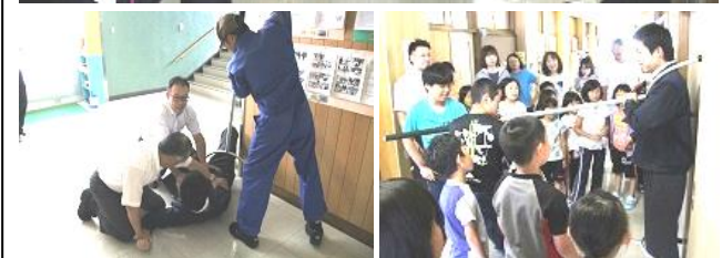
不審者対応避難訓練（8月29日）