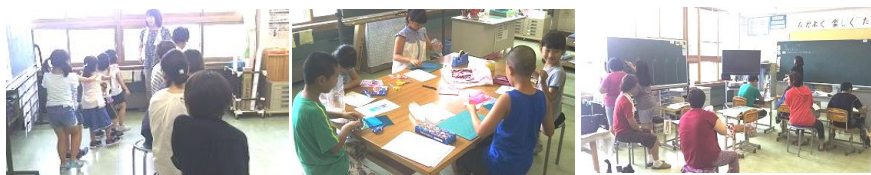
<1・2年生 音楽> <3・4年生 図工> <5・6年生 算数>

授業後の全体懇談の中で、次期学習指導要領の改訂に関わり、改定の概要と、学校行事等を含めた教育課程全体の見直しについてお話をいたしました。これまでの伝統や地域とのつながりを大切にしながら、教科の枠組みや授業時数、評価、指導法、学校行事など変えていかなければならないこともあります。今後は、保護者の皆様、地域の皆様にお伝えしながら、子どもたちのために進めてまいります。