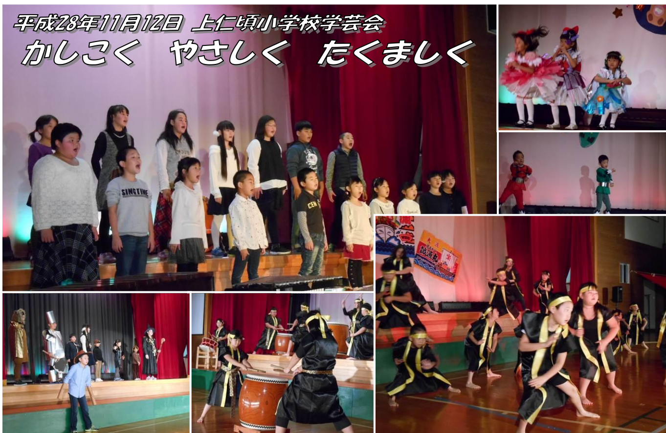
＜左上 合唱・右下 よさこいソーラン・右2枚 保育所年長さん・左下 劇 オズの魔法使いと和太鼓＞

11月12日(土)、厳しい寒さが続いていましたが、前日に比べると少し暖かい日となりました。早い時間からたくさんのご来賓・保護者の皆様・地域の皆様のご来場してくださいました。昨年と比べると、お客様が多く、椅子やスリッパが足りなくなり少し慌てる場面がありました。とても有り難いことです。次年度は、ご迷惑をかけないよう何とか工夫していきます。