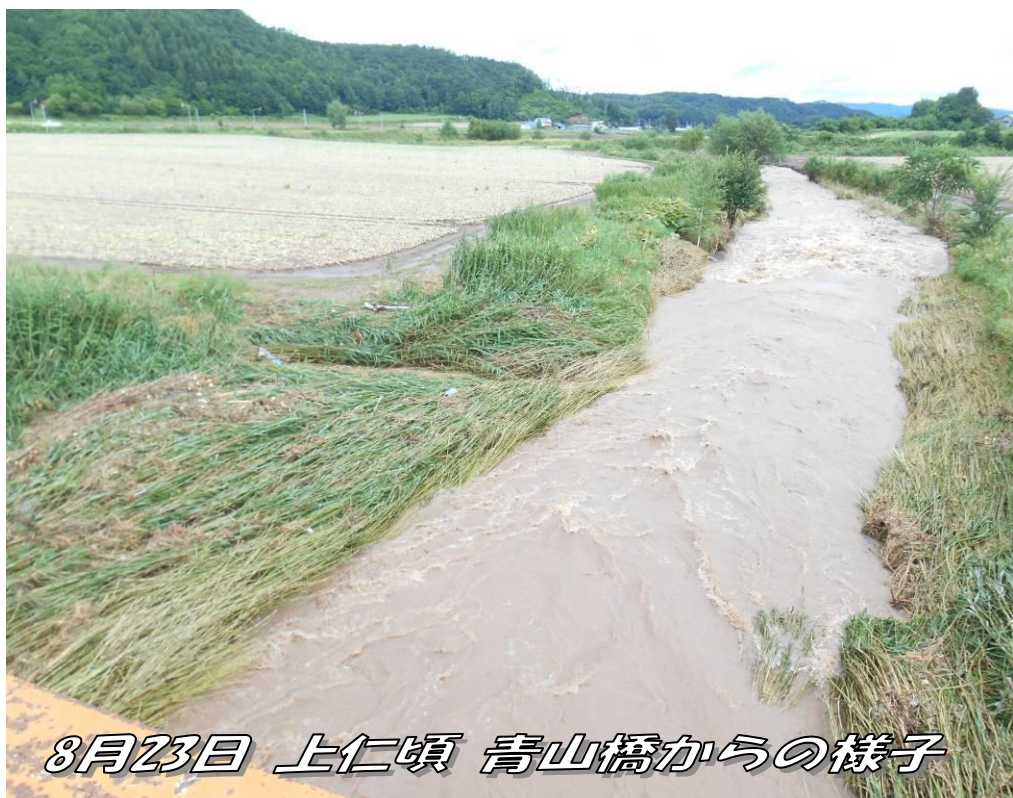
8月23日 上仁頃 青山橋からの様子