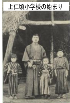
上仁頃小学校の始まり

上仁頃小学校の91才の誕生日は、今年は「敬老の日」とぶつかってしまいました。残念！でも、91才ですから、敬老の日がピッタリかもしれませんね。おめでとうございます！！