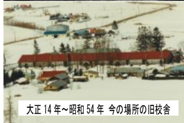
大正14年～昭和54年 今の場所の旧校舎