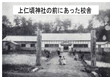
上仁頃神社の前にあった校舎

上仁頃の方であれば、きっと祖父母の方は、右下の旧校舎で勉強をし、お父さん・お母さんは今の校舎が新しい時に勉強したのではないのでしょうか？