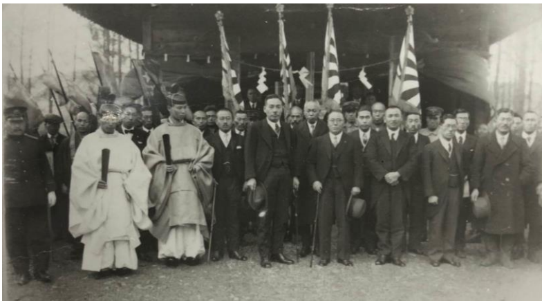
▲「村是確立報告祭」端野神社社殿前にて (手を組んでいる人が尾谷村長)

村是に定めた細目の実施にあたっては、村長を中心とした「地方委員会」が、村内の関係機関や団体等と連携協力し、前年に定めた「端野村経済更生計画」もあわせ、諸事業に取り組み、端野村の町勢の基盤を創り上げてきました。