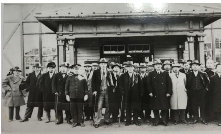
▲「村是確立報告祭記念」野付牛駅舎前にて