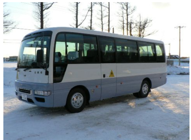
↑ スクールバス更新事業 (H21年度事業)