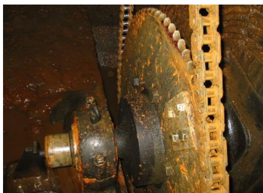
・スプロケット ・チェーン