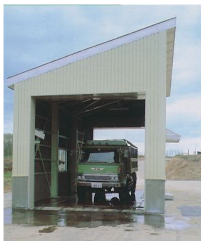
・トラックスケール