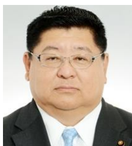
副議長 飯田 修司 平成30年4月19日就任