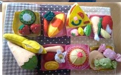
(→フェルトで作ったお菓子や野菜などのおもちゃ)